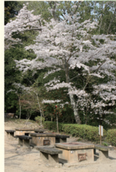
王滝溪谷バーベキュー場