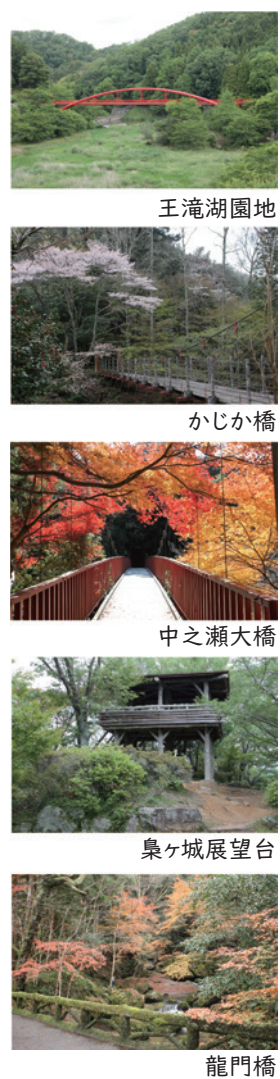
王滝湖園地 かじか橋 中之瀬大橋 梟ヶ城展望台 龍門橋

散策の注意 ・歩きやすい恰好・靴で歩く ・足元に注意して歩く ・散策路以外は歩かない ・日の入り1時間前には下山する ・道に迷ったら進まず戻る ・水分補給はこまめにする ・草むらに入らない、マムシなど毒蛇もいます ・野生動物・虫対策をして歩く ・動植物は持ち帰らない ・溪谷内、駐車場での事故や怪我、トラブルに関しては一切責任を負いかねます